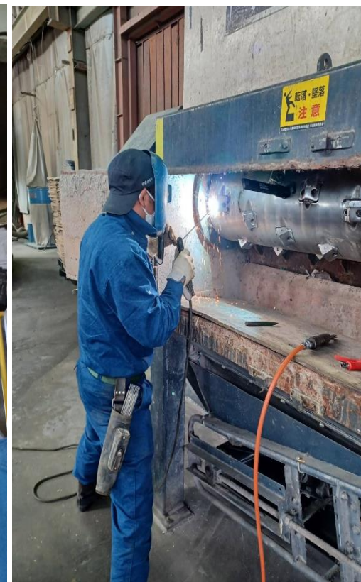
破碎機 オーバーホール